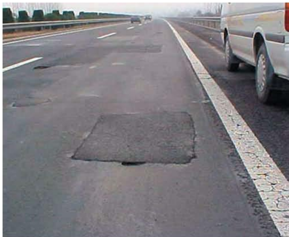
>>> Состояние поверхности покрытия на автомагистрали Нанкин - Шанхай до устройства защитного слоя

тумная эмульсия) фирмой «Shenzhen Shengtong Winway Emulsified Co. LTD» был построен защитный слой из ЛЭМС на опытном участке (одна полоса движения) автомагистрали Нанкин - Шанхай длиной 450 п.м. Хорошие результаты на опытном участке привели к началу широких работ по устройству защитного слоя; в марте-ноябре 2002 года на этой автомагистрали был устроен защитный слой в объеме 2 млн. м 2 с использованием 4-5 смесителей-укладчиков ЛЭМС фирмы «Bergkamp». Общий объем работ, выполненных на автомагистрали Нанкин - Шанхай в 2002-2003 годах, составил 3 млн. м 2 защитного слоя. Использовался состав ЛЭМС на щебне крупностью до 10 мм при преимущественном содержании фракции 5-10 мм. В сентябре 2006 года осмотр этой автомагистрали подтвердил высокое качество выполненных работ. Защитный слой и через 3,5 года эксплуатации выглядит очень хорошо. Всего с начала XXI века в КНР выполнено 80 млн. м 2 защитных слоев на автомастрадах, что обеспечило высокое транспортно-эксплуатационное качество поверхности покрытия и реально отодвинуло проведение работ по капитальному ремонту и даже реконструкции этих автомастр.