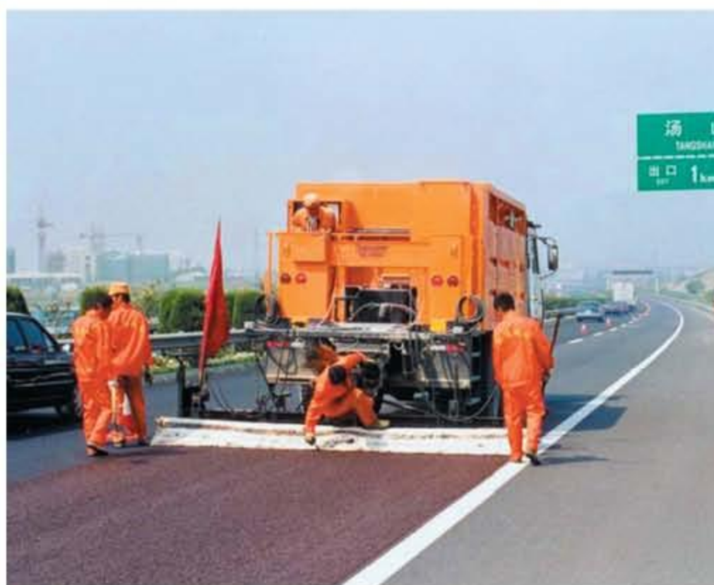
>>> Укладка слоя Slurry - Seal смесителем-укладчиком фирмы «Bergkamp»